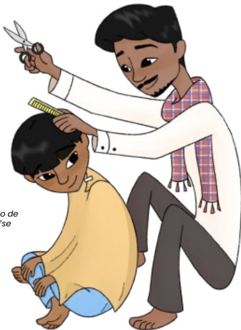
Ilustração de Jessica Tse