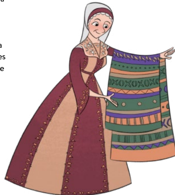
Ilustração de Whitney Hii