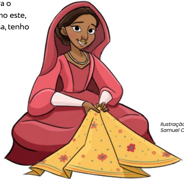
Ilustração de Samuel Chiu