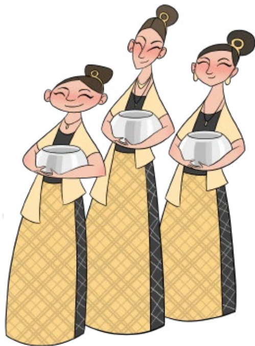
Ilustração de Whitney Hii