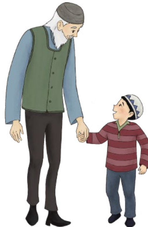
Ilustração de Becky Seo