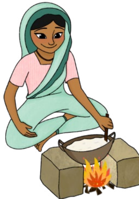
Ilustração de Jessica Tse