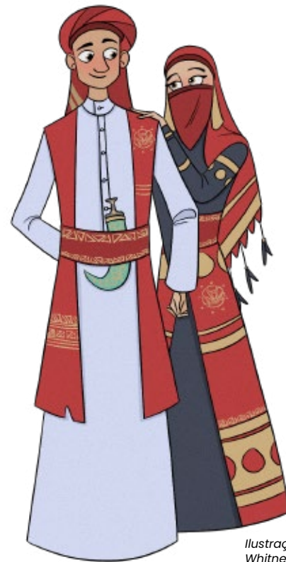
Ilustração de Whitney Hii