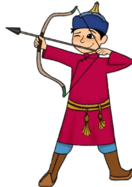
Ilustração de Jessica Tse