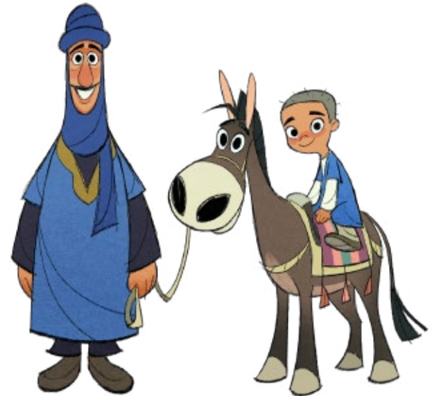
Ilustração de Ben Tong

Por meio dele e por causa do seu nome, recebemos graça e apostolado para chamar dentre todas as nações um povo para a obediência que vem pela fé. —ROMANOS 1:5