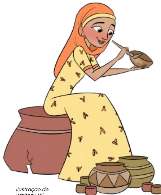
Ilustração de Whitney Hii