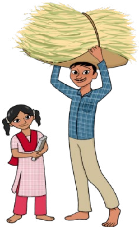
Ilustração de Jessica Tse