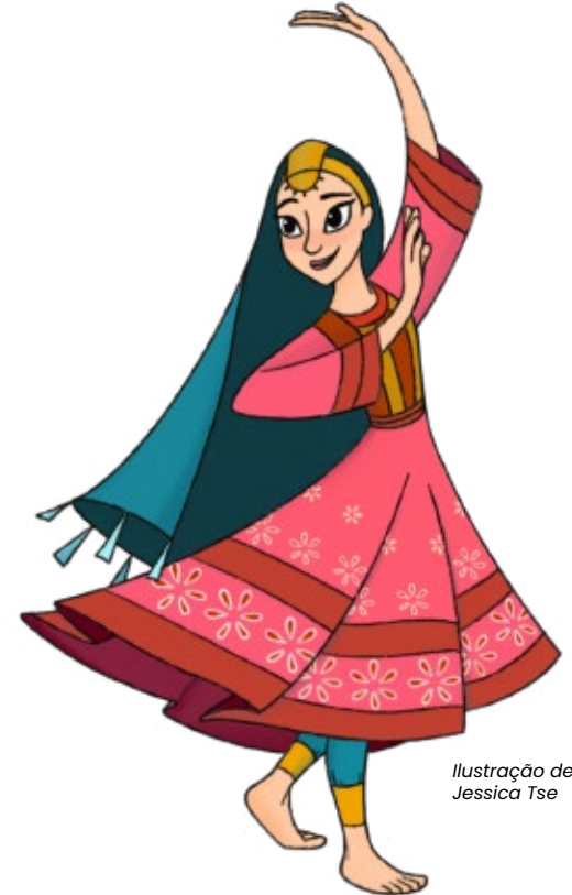
Ilustração de Jessica Tse