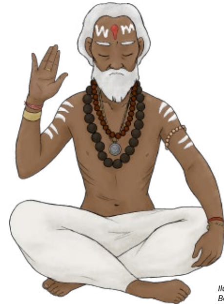
Ilustração de Becky Seo