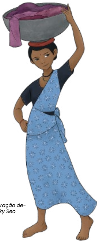
Ilustração de- Becky Seo