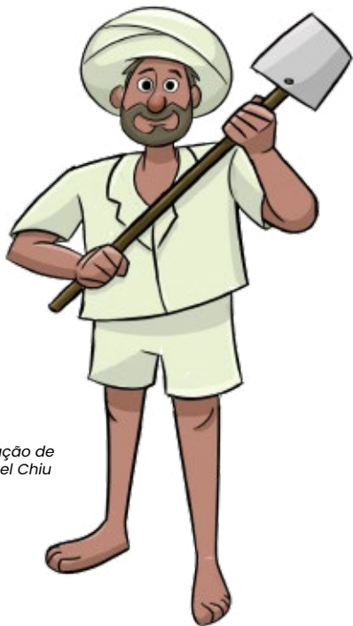
Ilustração de Samuel Chiu