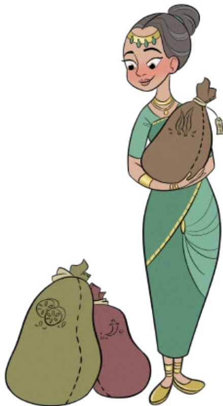
Ilustração de Whitney Hii