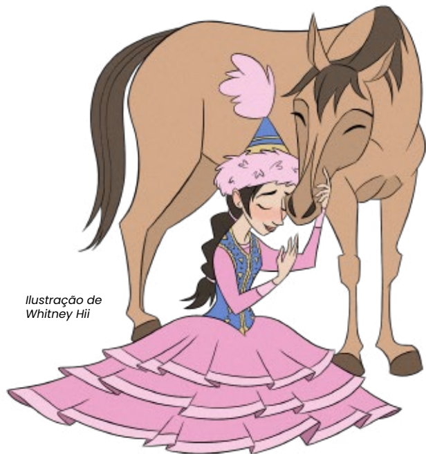
Ilustração de Whitney Hii