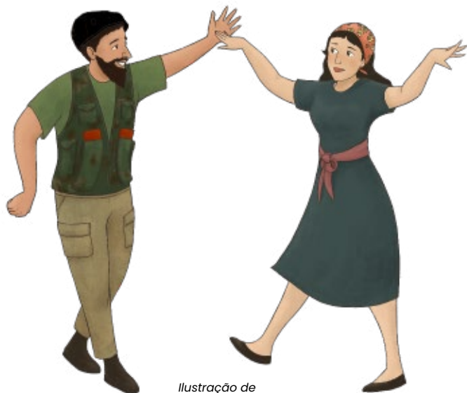
Ilustração de Becky Seo