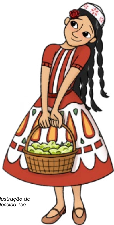
Ilustração de Jessica Tse