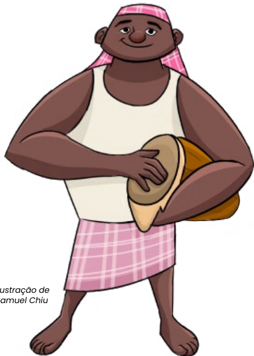
Ilustração de Samuel Chiu