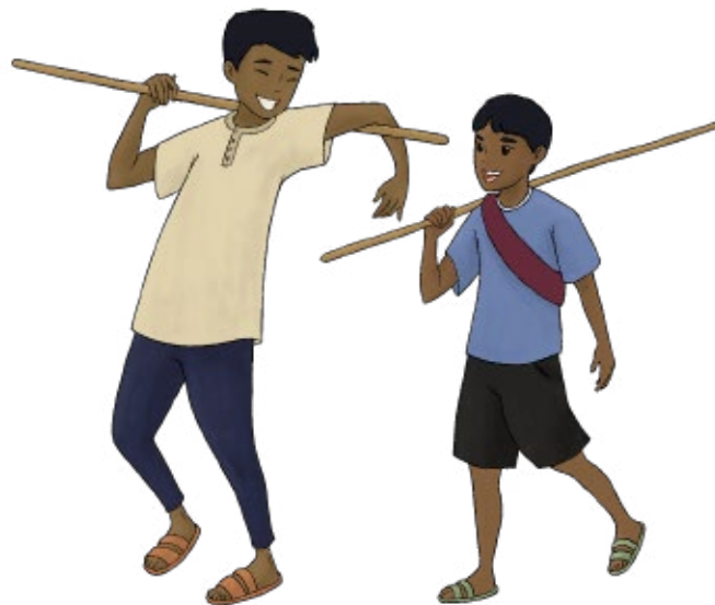
Ilustração de Becky Seo