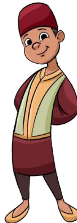
Ilustração de Samuel Chiu