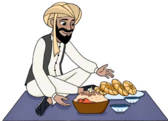
Ilustração de Jessica Tse