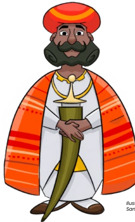
Ilustração de Samuel Chiu