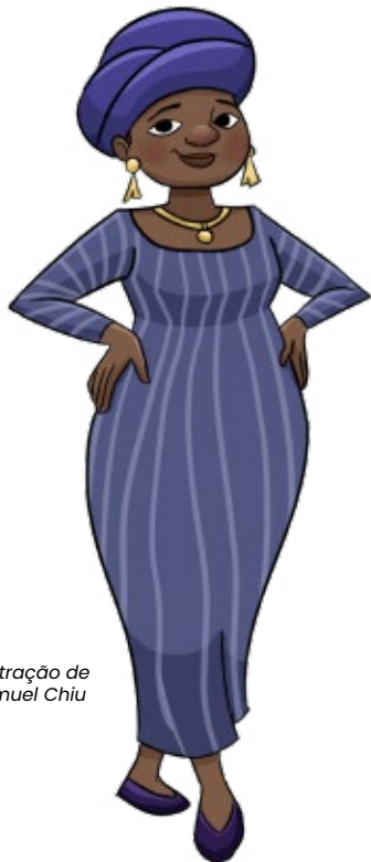
Ilustração de Samuel Chiu

Todas as nações que tu formaste virão e te adorarão, Senhor, e glorificarão o teu nome. – SALMOS 86:9