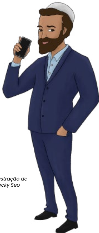
Ilustração de Becky Seo