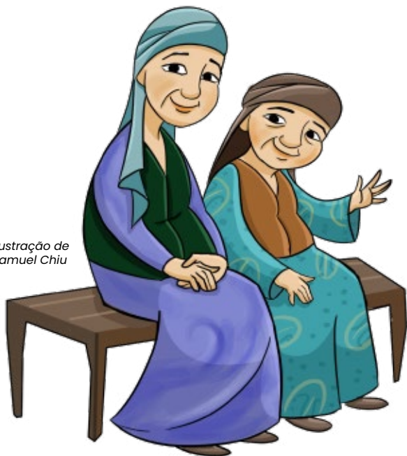
Ilustração de Samuel Chiu