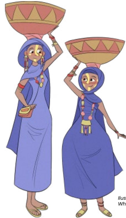
Ilustração de Whitney Hii