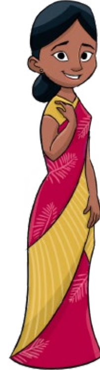
Ilustração de Samuel Chiu