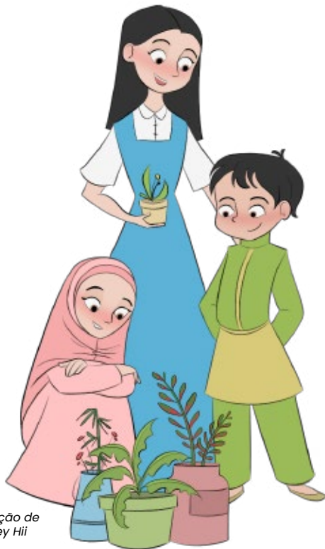
Ilustração de Whitney Hii